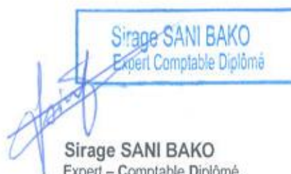
Sirage SANI BAKO Expert - Comptable Diplômé Expert-Comptable inscrit auprès de l'ONECCA Niger